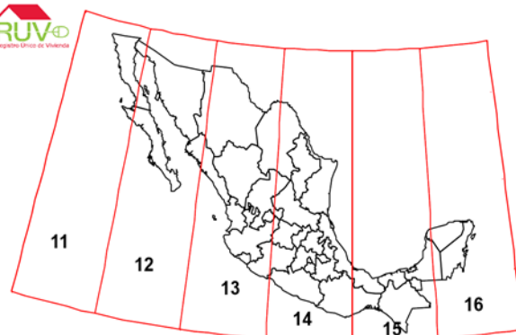
Zonas UTM de México