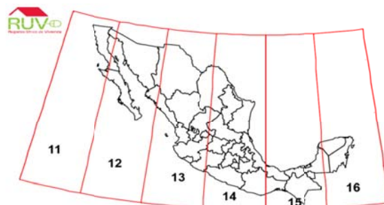
Zonas UTM de México

PLANO LLAVE. En el caso de que la reserva territorial forme parte de un predio mayor cuya propiedad se documenta en diferentes escrituras, o bien es una fracción de terreno de un predio, es obligatorio presentar un Plano Llave que permita identificar la superficie que contempla cada escritura o fracción registrada como reserva territorial.