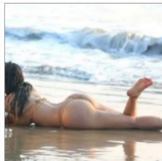
Celebridades imponen moda del “buttselkie”