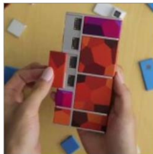
Google te enseña a armar tu propio Smartphone