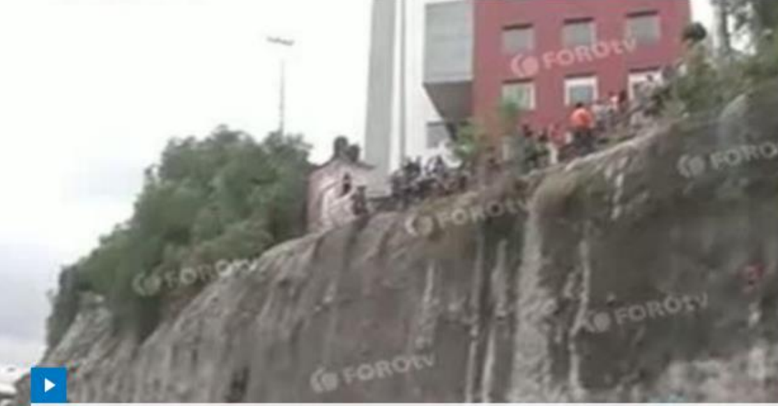
Derrumbe afecta la México-Querétaro

El deslave de un cerro en Tlalnepantla, Estado de México provoca el cierre, por cinco horas, de la Autopista México-Querétaro, en dirección al Distrito Federal