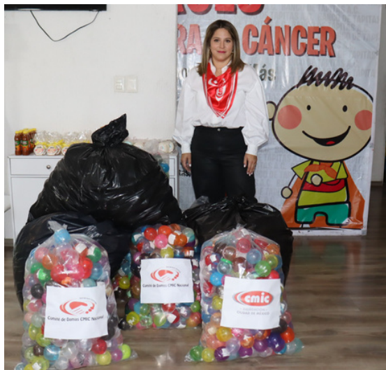
26 de septiembre

En unidad, en el estado de Morelos, tuvo lugar la Reunión Regional Centro País, integrada por nuestras delegaciones de Ciudad de México, Estado de México, Hidalgo, Morelos, Puebla, Querétaro y Tlaxcala.