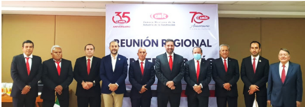
25 de septiembre

En unidad, en el estado de Morelos, tuvo lugar la Reunión Regional Centro País, integrada por nuestras delegaciones de Ciudad de México, Estado de México, Hidalgo, Morelos, Puebla, Querétaro y Tlaxcala.